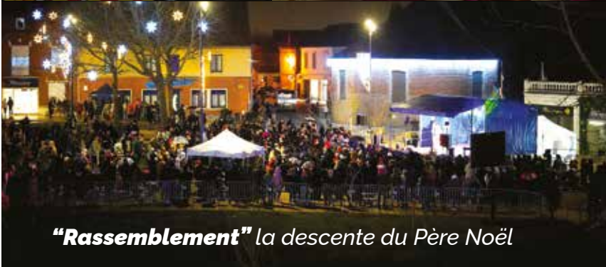
"Rassemblement" la descente du Père Noël