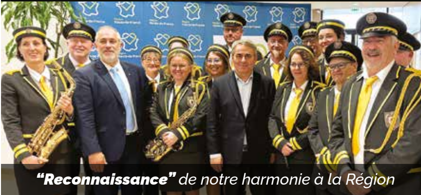
"Reconnaissance" de notre harmonie à la Région