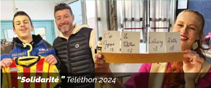
"Solidarité" Téléthon 2024