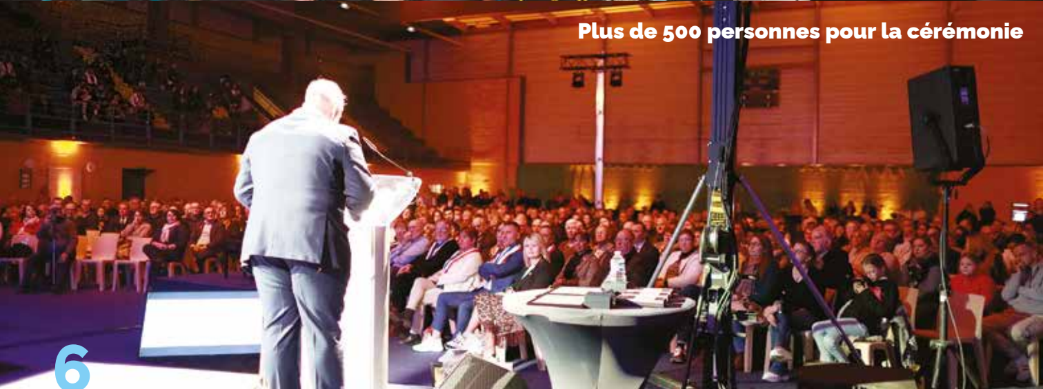
Plus de 500 personnes pour la cérémonie